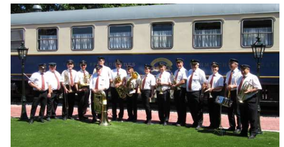
2019 - Aktuell im Böhmischen Prater

Eisenbahnermusik Wien SüdOst 1100 Wien, Jagdgasse 1b obmann@ems-wien.at