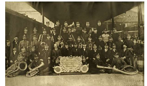
1919 - Gründungszeit am Ostbahnhof